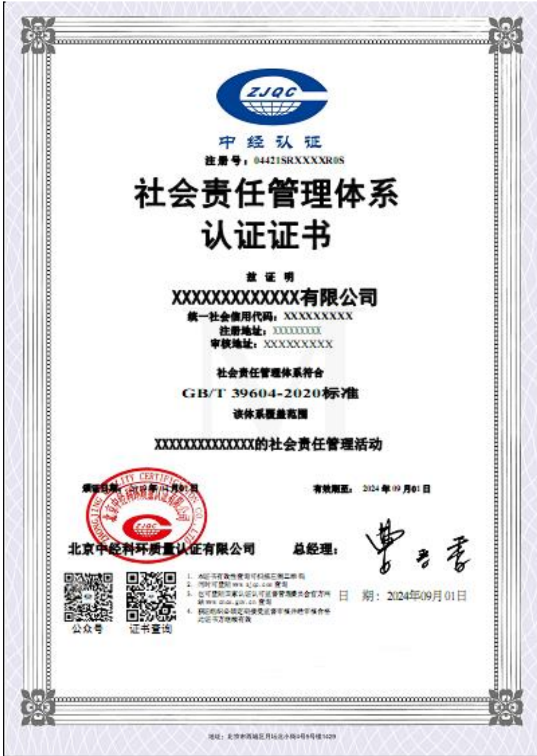
附件 1：社会责任管理体系认证证书样式